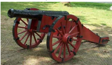
Afb. 4. Kanon uit de Bekhofschans 4