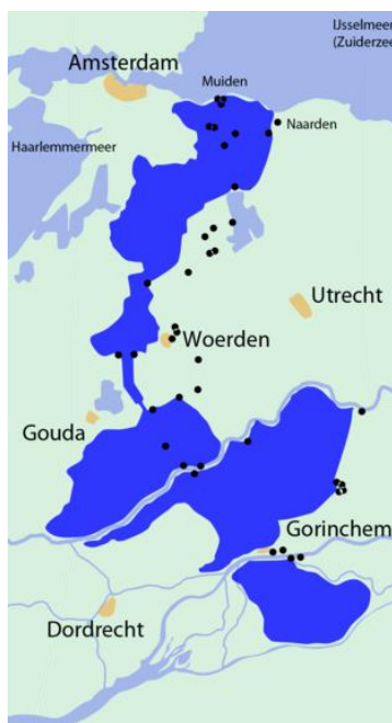
Afb. 1 Oude Hollandse Waterlinie 1

De Friese Waeterlinie (Nederlands: Friese Waterlinie ) is een verdedigingslinie die vanaf Kuinre, dat ooit aan de Zuiderzee lag, langs de riviertjes De Lende en De Kuunder in oostelijke richting loopt. Deze linie werd in de Tachtigjarige Oorlog rond 1580 aangelegd om Noord-Nederland tegen de vijandelijke Spaanse troepen te beschermen. De Friese Waeterlinie was in feite een verlengstuk van de Hollandse Waterlinie: de verdedigingslijn van water reikte van Zuid-Nederland tot aan de Zuiderzee. Deze (Oude) Hollandse Waterlinie wist vanaf 1573 al Franse soldaten grotendeels uit Holland te weren. In de 17 e eeuw werd De Hollandse Waterlinie versterkt. Vanwege zijn nieuwe vorm kreeg de waterlinie vanaf 1871 ook een nieuwe naam: Nieuwe Hollandse Waterlinie .